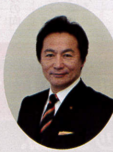
亀岡市長 桂川孝裕

さらに、同じく2020年には、京都府が本市に建設中の京都スタジアム(仮称)がオープンする予定となっております。ますます、当スタジアム及び周辺はスポーツを活かした新たな交流拠点として、市民の健康、まちのにぎわい、子ども達の夢の実現へとつながるような環境づくりを、関係団体の方々と共に進めてまいりたいと思っております。