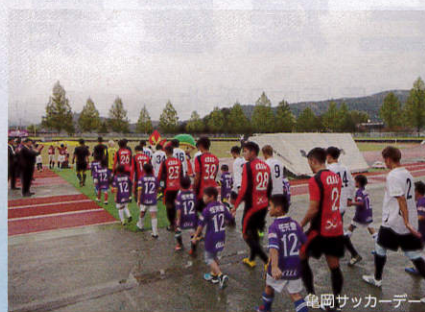
亀岡サッカーデー