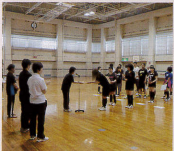
ソフトバレーボール大会

誰もがスポーツに親しむことができる生涯スポーツ事業「かめおか市民スポーツフェスティバル」を開催しました。町対抗競技の部としてソフトバレーボール大会を5月に、ソフトボール大会を6月に実施しました。大会当日は熱戦がくり広げられ、大変盛り上がりしました。また10月に開催予定のスポーツ健康フェスタは台風接近に伴う暴風警報発令の為、残念ながら中止となりました。