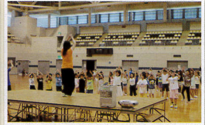
6月17日/キッズダンス