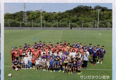
サンガタウン見学