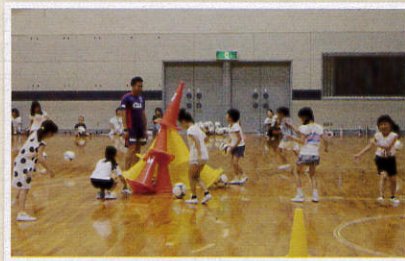
6月24日/室内サッカー