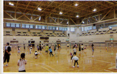
5月27日/バドミントン