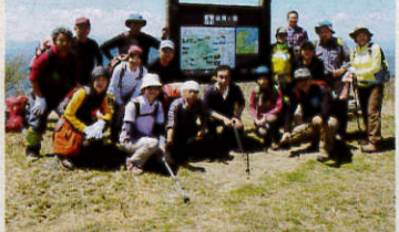
平成29年4月23日 由良ヶ岳山頂にて(登山大会下山)

登山大会は、市民を対象に山の楽しさを知ってもらうことを目標に取り組んでいます。昨年度は、赤坂山(滋賀県)で実施しました。今年度は由良ヶ岳(京都府)を計画しています。詳しくは、亀岡山岳会のホームページをご覧ください。