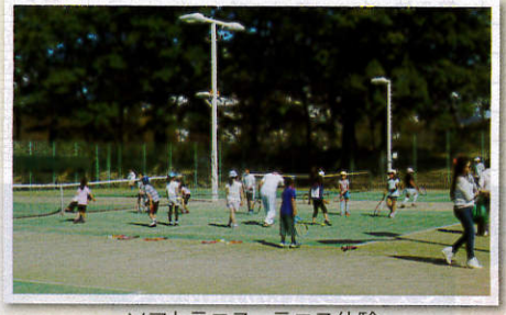
ソフトテニス、テニス体験