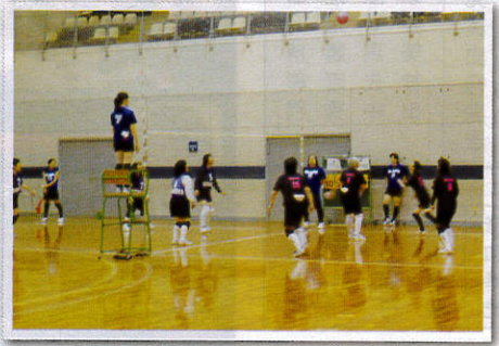
町対抗競技/ソフトバレーボール大会