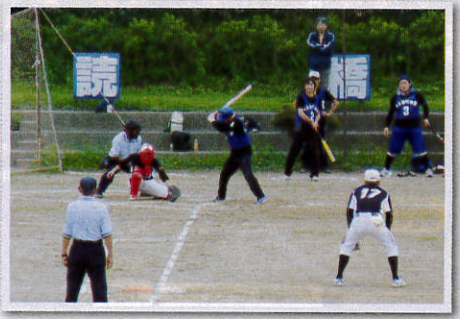
町対抗競技/ソフトボール大会