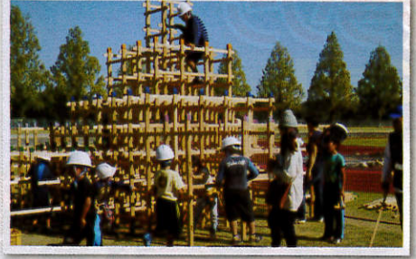
キッズチャレンジコーナー