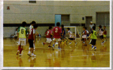
室内サッカー体験