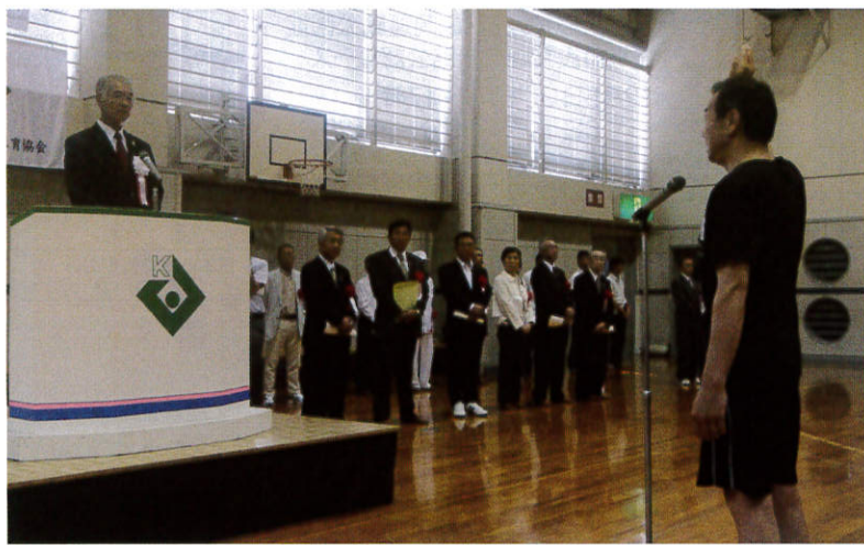
亀岡市民総合体育大会 総合開会式 (平成26年6月1日)

市民が広くスポーツ活動に親しみ、地域コミュニティの活性化と、生涯スポーツの社会の実現を目指して、平成12年(2000年)第1回亀岡市民総合体育大会が開幕しました。地域対抗形式により、当初は9種目から始まりましたが、参加チーム数などにより競技種目の内容の見直しをする中で、平成26年度には第15回の節目を迎え、これを以てファイナルすることとなりました。本年からは、かめおか市民スポーツフェスティバルとして、2種目の町対抗競技と本年10月18日(日)にスポーツ健康フェスタとして新事業を事業委員会で内容の協議をしています。各種関係団体の皆様には、ご協力いただき厚くお礼申し上げますとともに、新事業につきましても、趣旨をご理解いただきご協力お願いいたします。