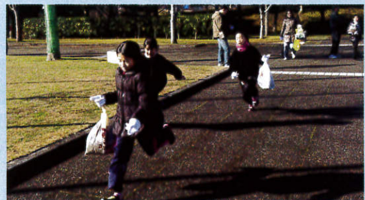
スポーツ少年団による清掃活動 (平成26年12月13日)

●亀岡市スポーツ少年団事務局 (TEL 24-8385) へご連絡いただければ、各団の代表者のご紹介をさせていただきます。各団の練習会場をご存知の方は、直接会場へ行っていただいても結構です。